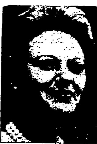
السيرة الإيطالية الجديدة يضح كليلان الزهور على ضريح المقبرة له المكعب الله

بوتسدامي «البلبا» - ويترس - توفيت امس زوربان والاس حكمة الينا هنا في وقت مبكر امس بعد ان قامت السرطان ثلاث سنوات. وتحت السر والاس قد دخلت المستشفى عدة مرات في السنة الماضية لمعالجتها من سرطان في الحوض.